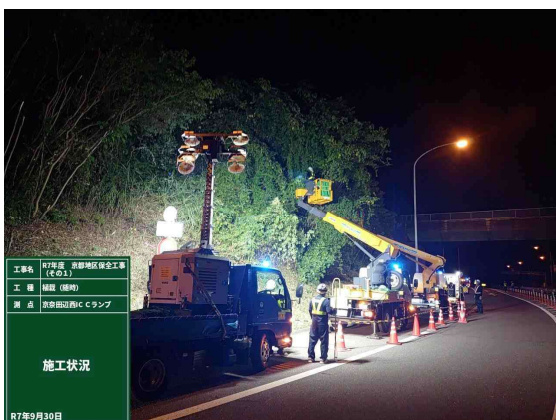
【京奈道路夜間通行止め（植栽）】

期間中は日常作業もあり、工程管理と人員の確保が課題となり、何よりも高速道路を利用されているお客様の安全確保は最重要ではありますが、保安全管理に従事する人の安全確保も常に考えていきたいと思っております。 ご安全に！