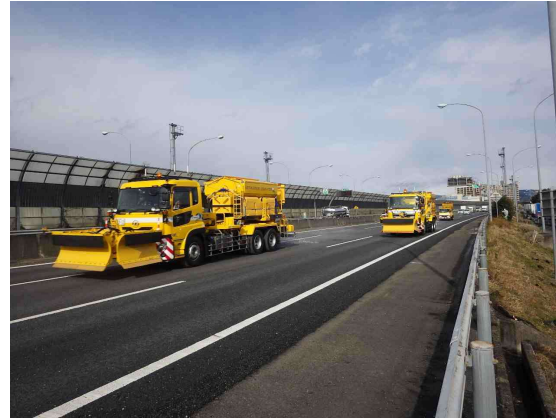
【雪氷対策（凍結防止剤散布）】