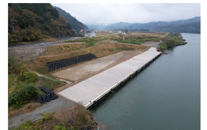
【由良川志高地区河道掘削工事】