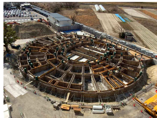
【久御山町全世代・全員活躍