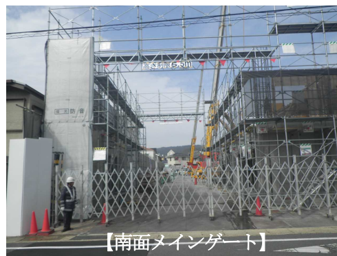
【(仮称)ドーマー山科東野計画】